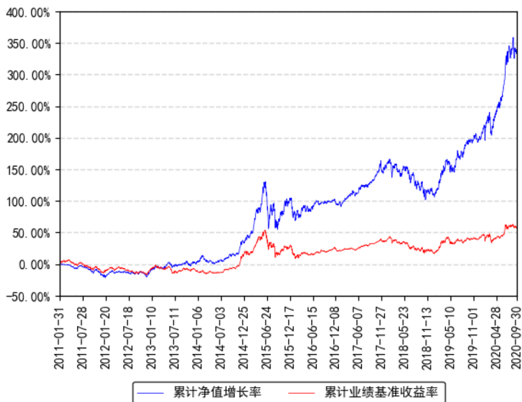
南方优选成长A累计净值增长率与同期业绩比较基准收益率的历史走势对比图