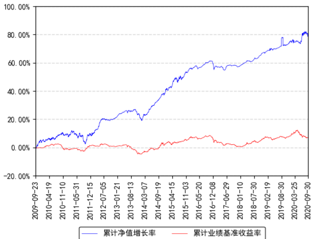
南方多利增强债券A累计净值增长率与同期业绩比较基准收益率的历史走势对比图