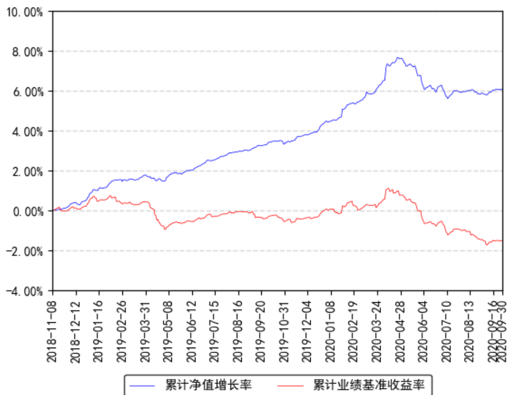
南方1-3年国开债A累计净值增长率与同期业绩比较基准收益率的历史走势对比图