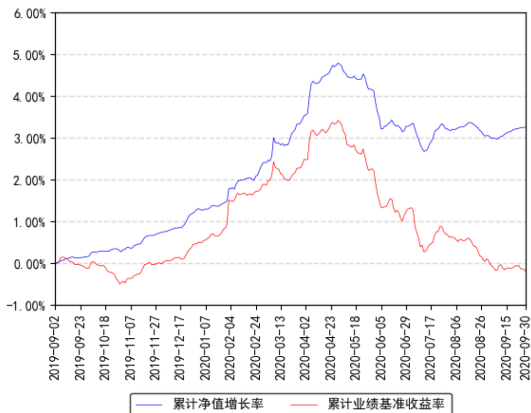
南方聪元A累计净值增长率与同期业绩比较基准收益率的历史走势对比图