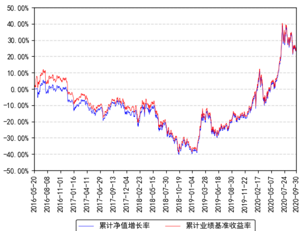
南方创业板ETF联接累计净值增长率与同期业绩比较基准收益率的历史走势对比图