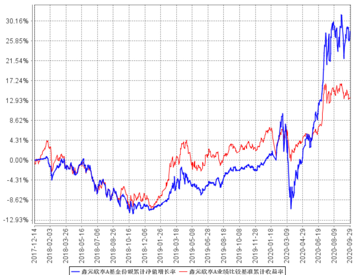
鑫元欣享A基金份额累计净值增长率与同期业绩比较基准收益率的历史走势对比图