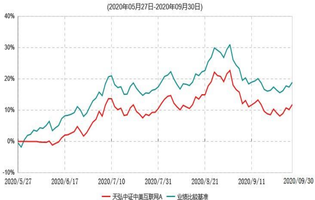
天弘中证中美互联网A累计净值增长率与业绩比较基准收益率历史走势对比图