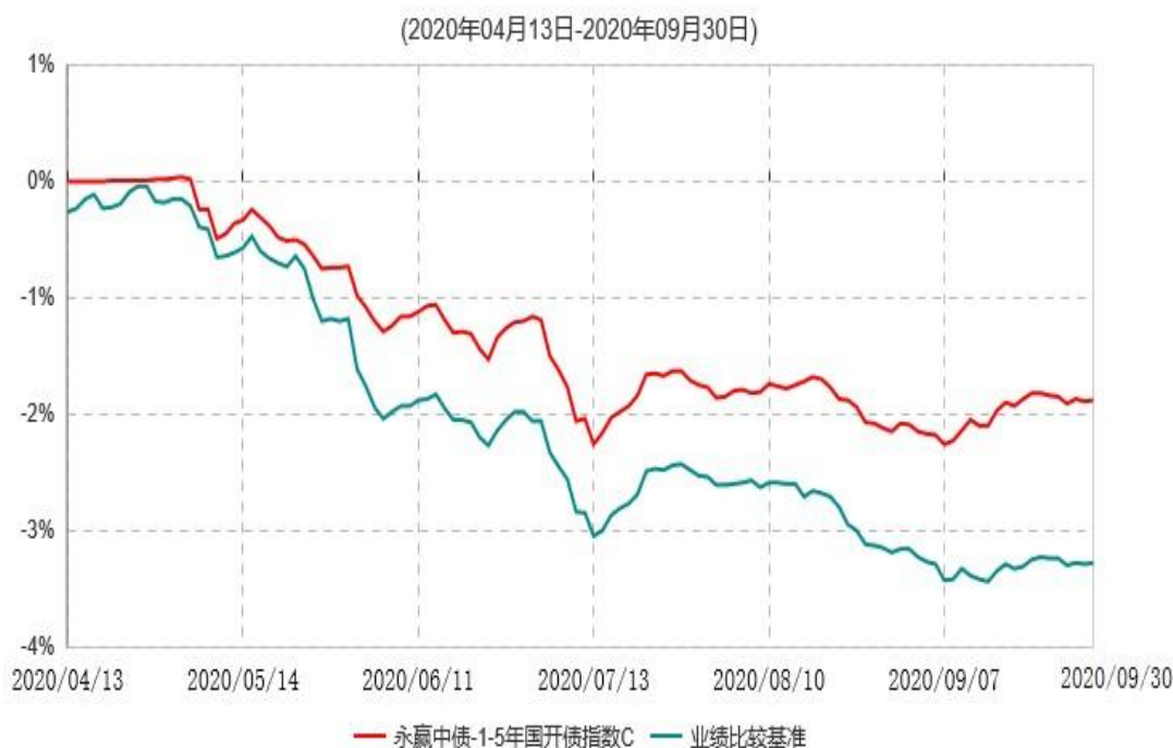
永赢中债-1-5年国开债指数C累计净值增长率与业绩比较基准收益率历史走势对比图