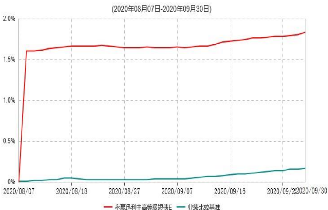
永赢迅利中高等级短债E累计净值增长率与业绩比较基准收益率历史走势对比图

注：本基金自 2020 年 8 月 7 日增设 E 类基金份额，截至本报告期末，本类基金份额生效未满 1 年。