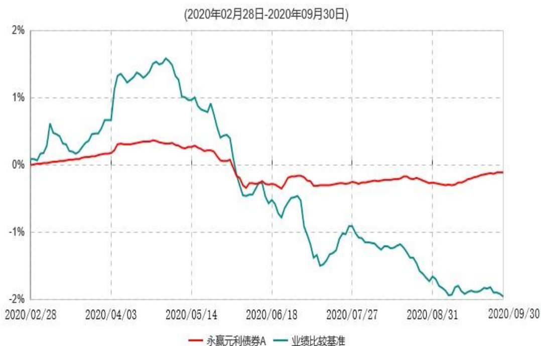
永赢元利债券A累计净值增长率与业绩比较基准收益率历史走势对比图

注：1、本基金合同生效日为 2020 年 2 月 28 日，截至本报告期末本基金合同生效未满 1 年；