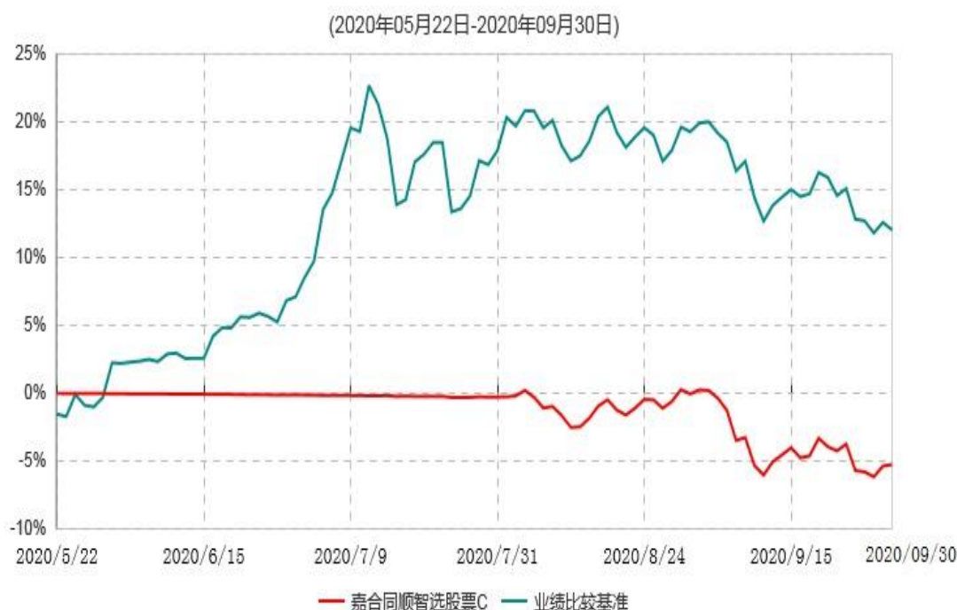
嘉合同顺智选股股票C累计净值增长率与业绩比较基准收益率历史走势对比图

2、本基金基金合同于 2020 年 5 月 22 日生效，按照基金合同规定，本基金建仓期为基金合同生效之日起 6 个月。