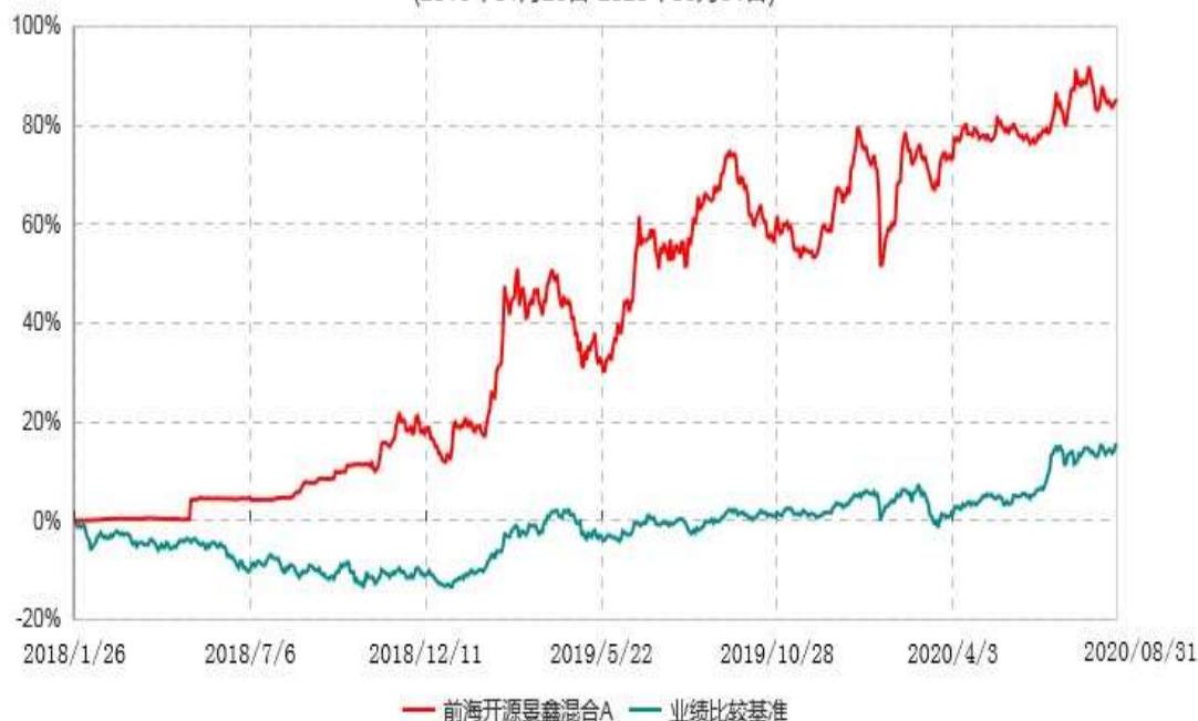
前海开源景鑫混合C累计净值增长率与业绩比较基准收益率历史走势对比图