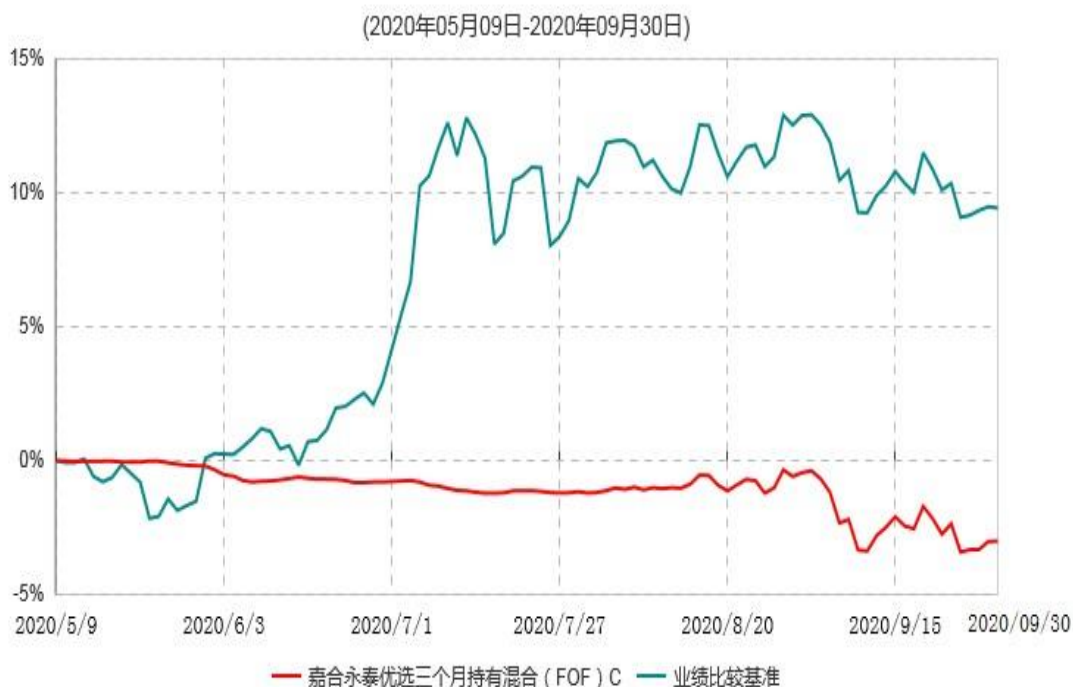
嘉合永泰优选三个月持有混合（FOF）C累计净值增长率与业绩比较基准收益率历史走势对比图

注：1、本基金基金合同于2020年5月9日生效。截至本报告期末，本基金基金合同生效不满一年。