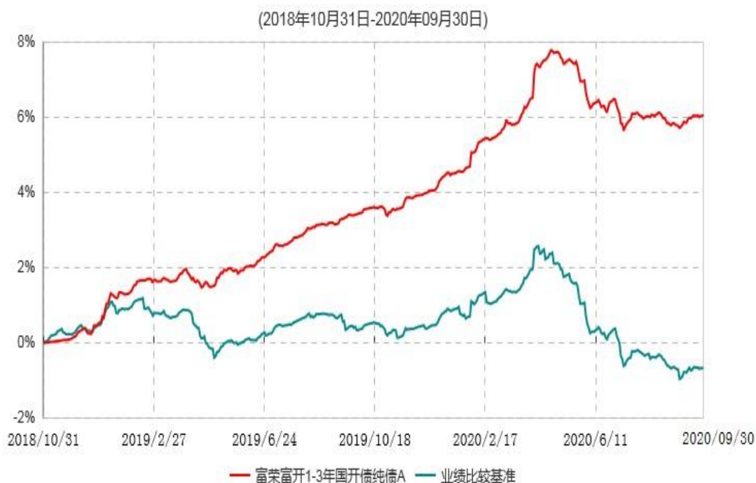
富荣富开1-3年国开债纯债A累计净值增长率与业绩比较基准收益率历史走势对比图