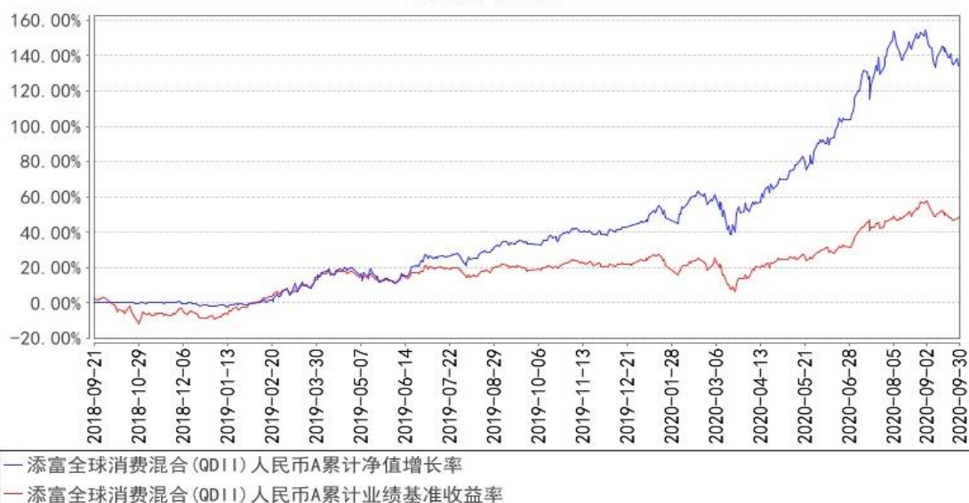
添富全球消费混合(QDII)人民币A累计净值增长率与同期业绩比较基准收益率的历史走势对比图