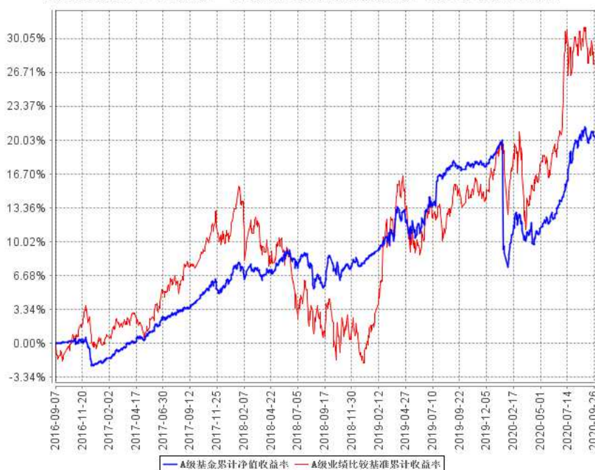
A级基金累计净值收益率与同期业绩比较基准收益率的历史走势对比图