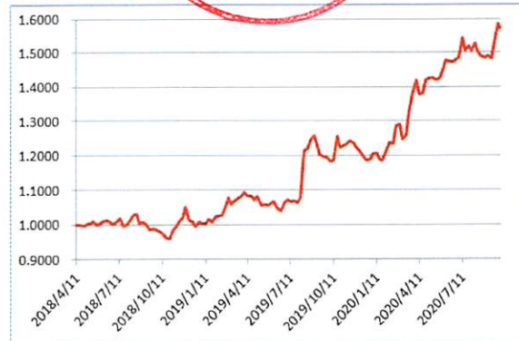
累计净值曲线 (2018/4/11 至 2020/9/30)