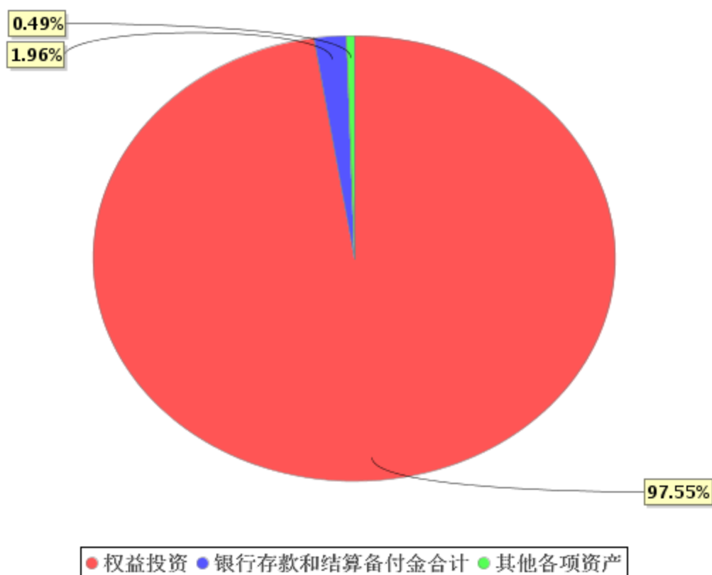
投资组合资产配置图表(2020年6月30日)