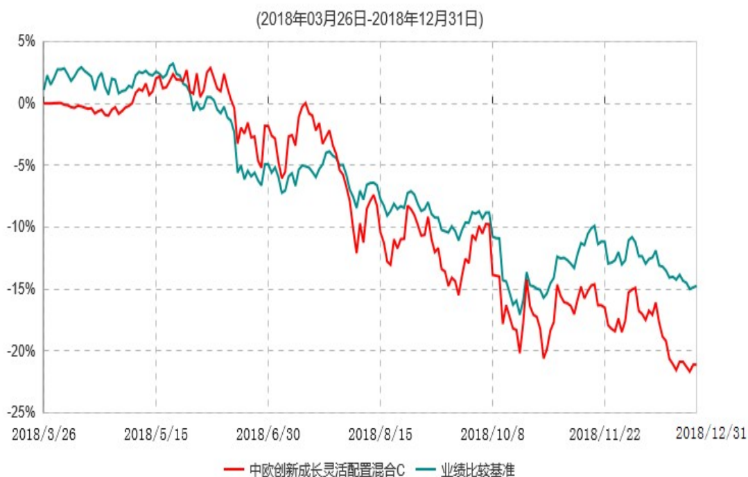
中欧创新成长灵活配置混合C累计净值增长率与业绩比较基准收益率历史走势对比图

注：本基金基金合同生效日期为2018年3月26日，自基金合同生效日起到本报告期末不满一年，按基金合同的规定，本基金自基金合同生效起六个月为建仓期，建仓期结束时各项资产配置比例已符合基金合同约定。