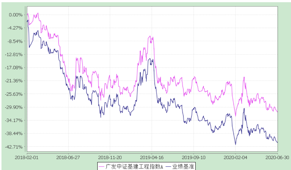
(2) 广发中证基建工程指数 C: