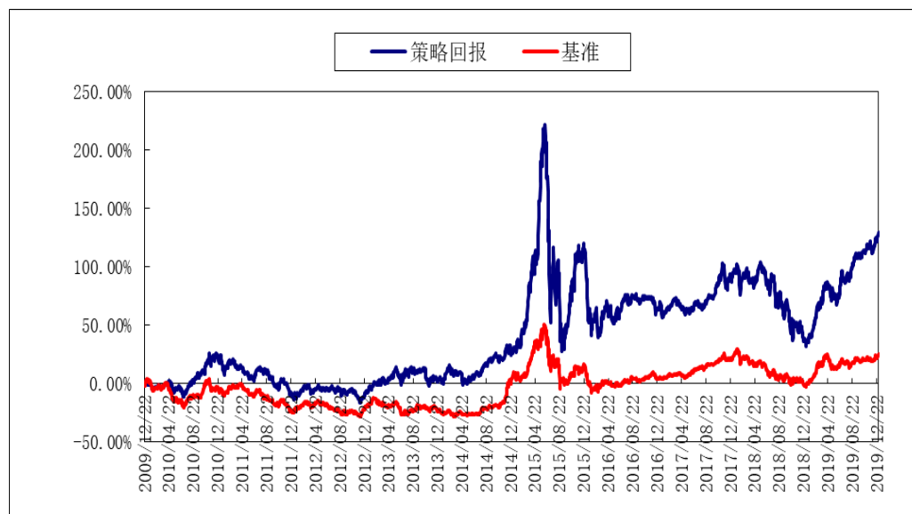
(二)自基金合同生效以来基金累计净值增长率变动及其与同期业绩比较基准收益率变动的比较图