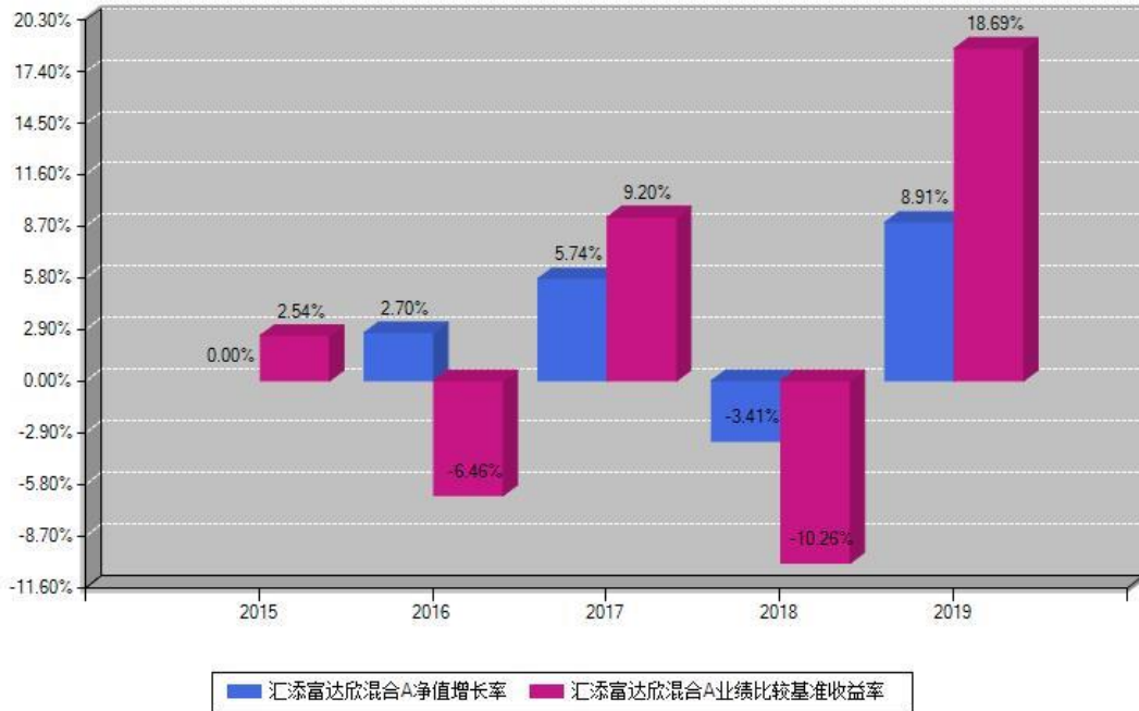
汇添富达欣混合A每年净值增长率与同期业绩基准收益率对比图

注：基金的过往业绩不代表未来表现。本《基金合同》生效之日为2015年12月02日，合同生效当年按实际存续期计算，不按整个自然年度进行折算。