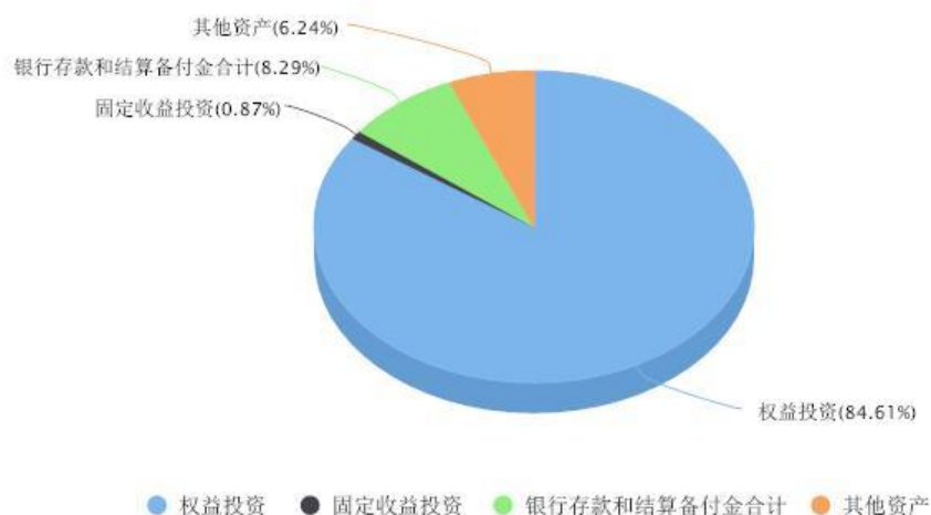
添富全球消费混合(QDII)人民币C区域配置图表