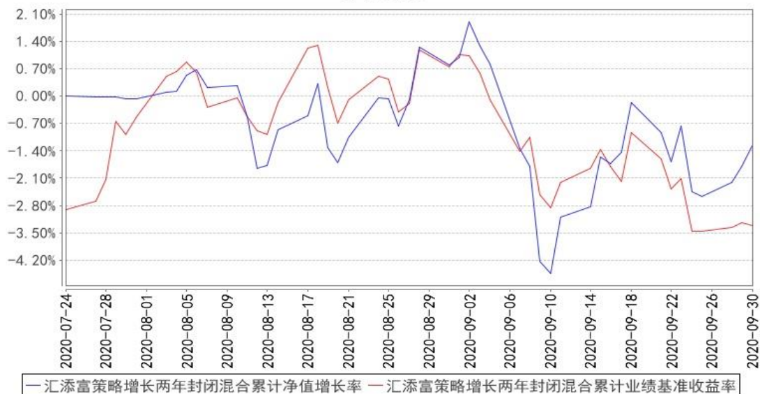
汇添富策略增长两年封闭混合累计净值增长率与同期业绩比较基准收益率的历史走势对比图