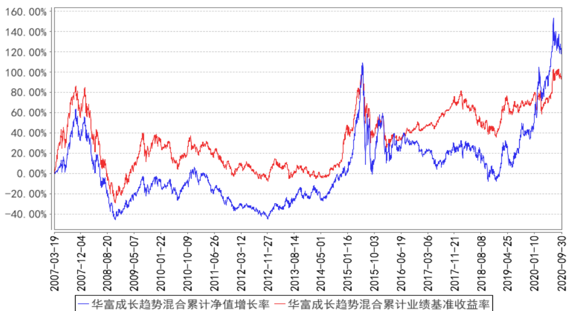
华富成长趋势混合累计净值增长率与同期业绩比较基准收益率的历史走势对比图