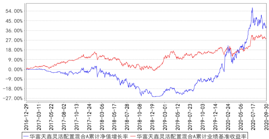
华富天鑫灵活配置混合A累计净值增长率与同期业绩比较基准收益率的历史走势对比图

(二)自基金合同生效以来基金份额累计净值增长率变动及其与同期业绩比较基准收益率变动的比较