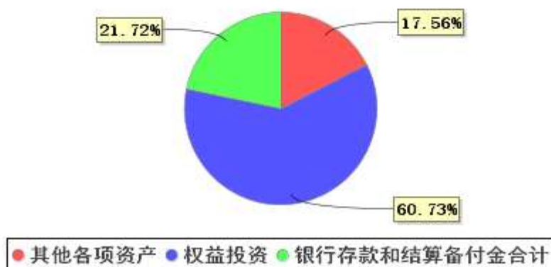
投资组合资产配置图表(2020年9月30日)