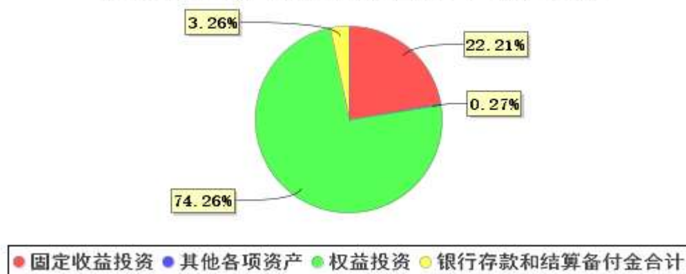
投资组合资产配置图表(2020年9月30日)