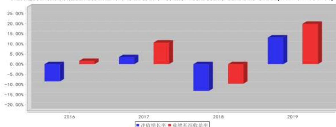
大成趋势回报灵活配置混合基金每年净值增长率与同期业绩比较基准收益率的对比图(2019年12月31日)