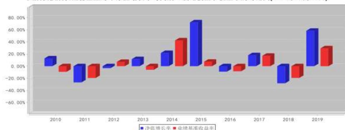
大成积极成长混合基金每年净值增长率与同期业绩比较基准收益率的对比图(2019年12月31日)