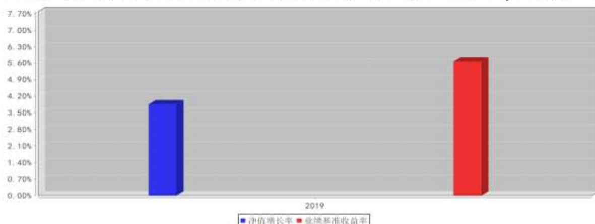
大成MSCI价值100ETF联接基金A基金每年净值增长率与同期业绩比较基准收益率的对比图(2019年12月31日)