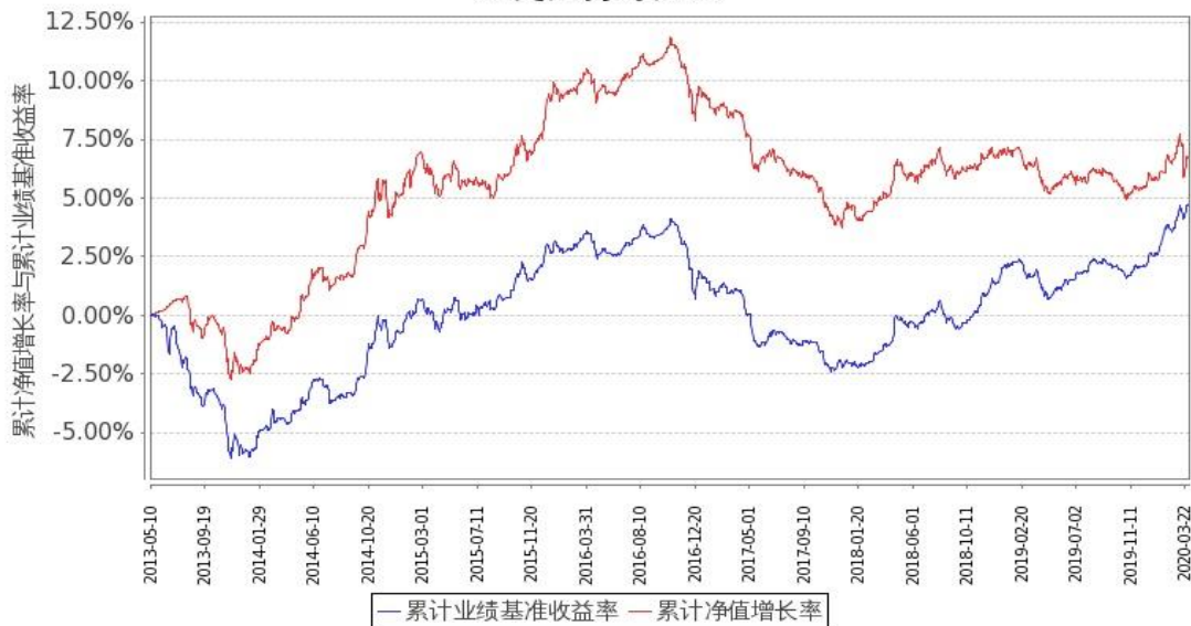
图 1: 嘉实中证金边中期国债 ETF 联接 A 基金份额累计净值增长率与同期业绩比较基准收益率的历史走势对比图 (2013 年 5 月 10 日至 2020 年 3 月 31 日)