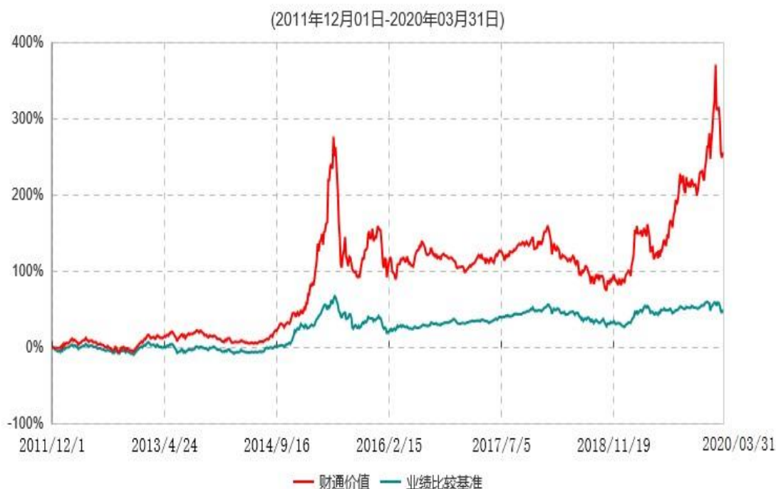
财通价值动量混合型证券投资基金累计净值增长率与业绩比较基准收益率历史走势对比图