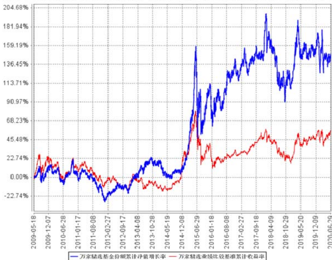
万家精选基金份额累计净值增长率与同期业绩比较基准收益率的历史走势对比图

注: 本基金于2009年5月18日成立, 根据基金合同规定, 基金合同生效后六个月内为建仓期, 建仓期结束时各项资产配置比例符合法律法规和基金合同要求。报告期末各项资产配置比例符合法律法规和基金合同要求。