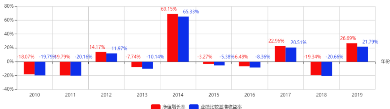
基金每年的净值增长率及与同期业绩比较基准的比较图