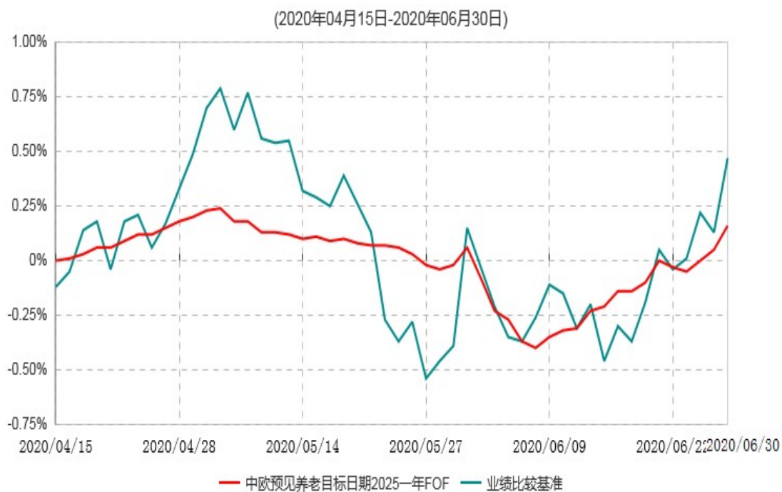
中欧预见养老目标日期2025一年持有期混合型基金中基金（FOF）累计净值增长率与业绩比较基准收益率历史走势对比图

注：本基金基金合同生效日期为2020年4月15日，自基金合同生效日起到本报告期末不满一年，按基金合同的规定，本基金自基金合同生效起六个月为建仓期，建仓期结束时各项资产配置比例应当符合基金合同约定。