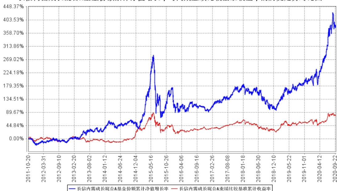
长信内需成长混合A基金份额累计净值增长率与同期业绩比较基准收益率的历史走势对比图

自基金合同生效以来基金份额累计净值增长率变动及其与同期业绩比较基准收益率变动的比较：