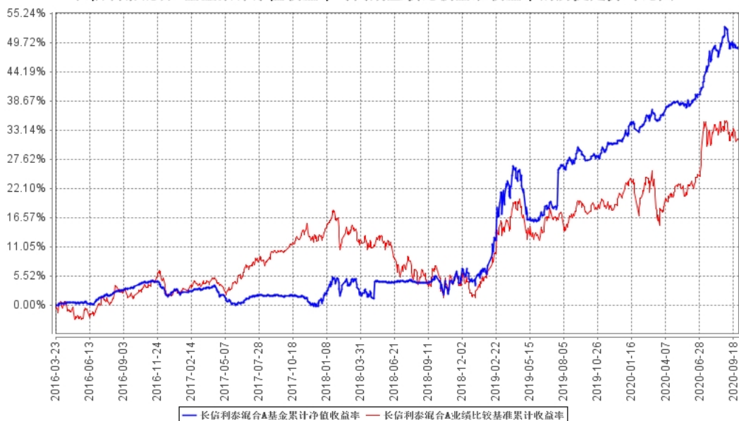
长信利泰混合A基金累计净值收益率与同期业绩比较基准收益率的历史走势对比图

自基金合同生效以来基金份额累计净值增长率变动及其与同期业绩比较基准收益率变动的比较