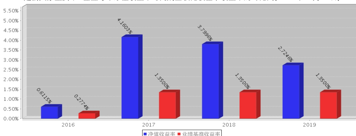
建信天添益货币A基金每年净值收益率与同期业绩比较基准收益率的对比图(2019年12月31日)