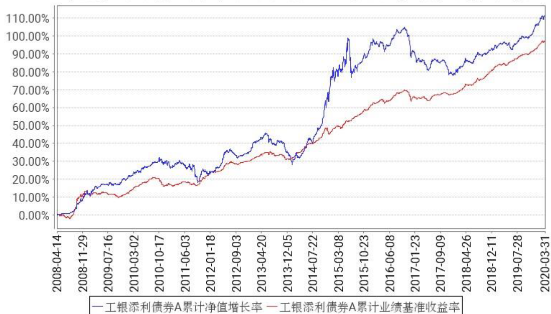
工银添利债券A累计净值增长率与同期业绩比较基准收益率的历史走势对比图