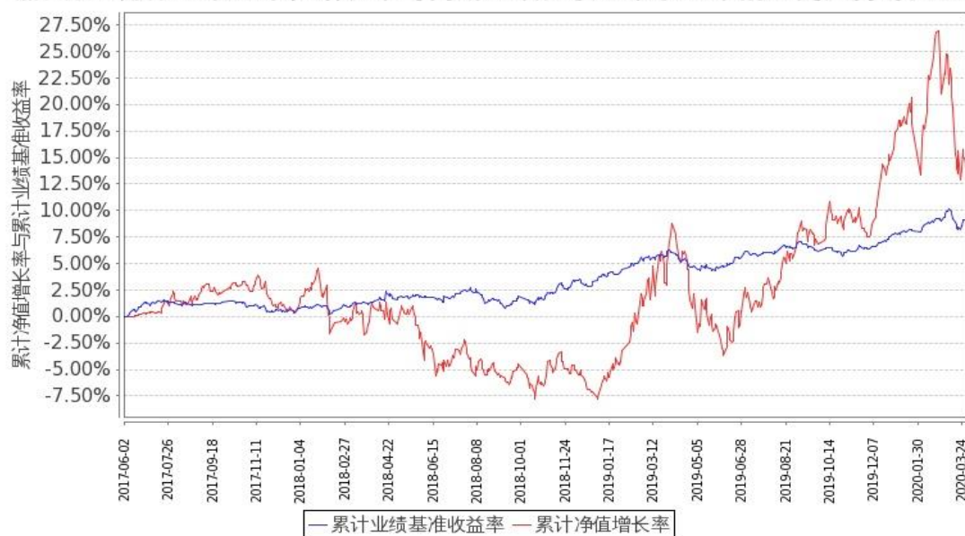
图 2：嘉实稳宏债券 C 基金份额累计净值增长率与同期业绩比较基准收益率的历史走势对比图