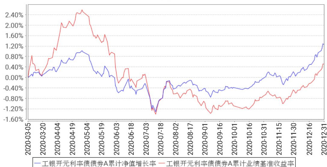
工银开元利率债债券A累计净值增长率与同期业绩比较基准收益率的历史走势对比图