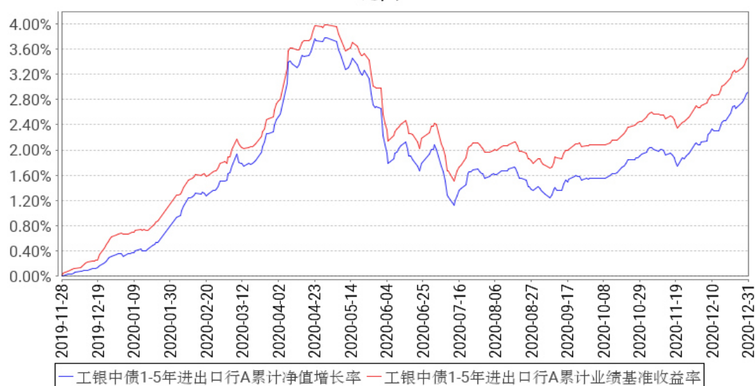
工银中债1-5年进出口行A累计净值增长率与同期业绩比较基准收益率的历史走势对比图