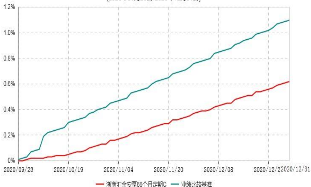
浙商汇金安享66个月定期C累计净值增长率与业绩比较基准收益率历史走势对比图 (2020年09月23日-2020年12月31日)

注：本基金合同生效日为 2020 年 9 月 23 日，自基金合同生效日起至本报告期末不满一年。至本报告期末，本基金尚未完成建仓。