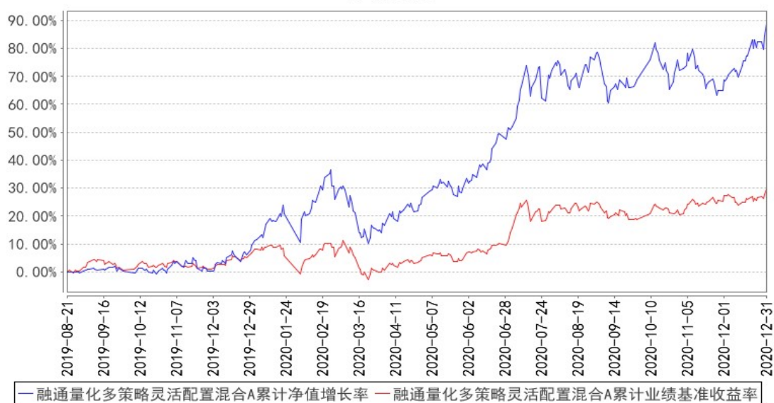
融通量化多策略灵活配置混合A累计净值增长率与同期业绩比较基准收益率的历史走势对比图