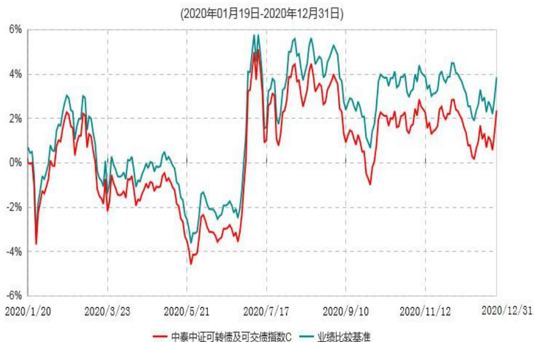
中泰中证可转债及可交换指数C累计净值增长率与业绩比较基准收益率历史走势对比图