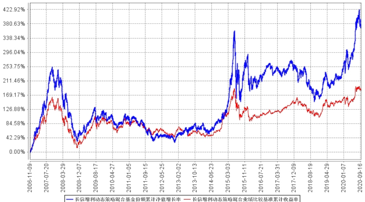
长信增利动态策略混合基金份额累计净值增长率与同期业绩比较基准收益率的历史走势对比图

自合同生效之日（2006年11月9日）至2020年9月30日期间，本基金份额累计净值增长率与同期业绩比较基准收益率历史走势对比：