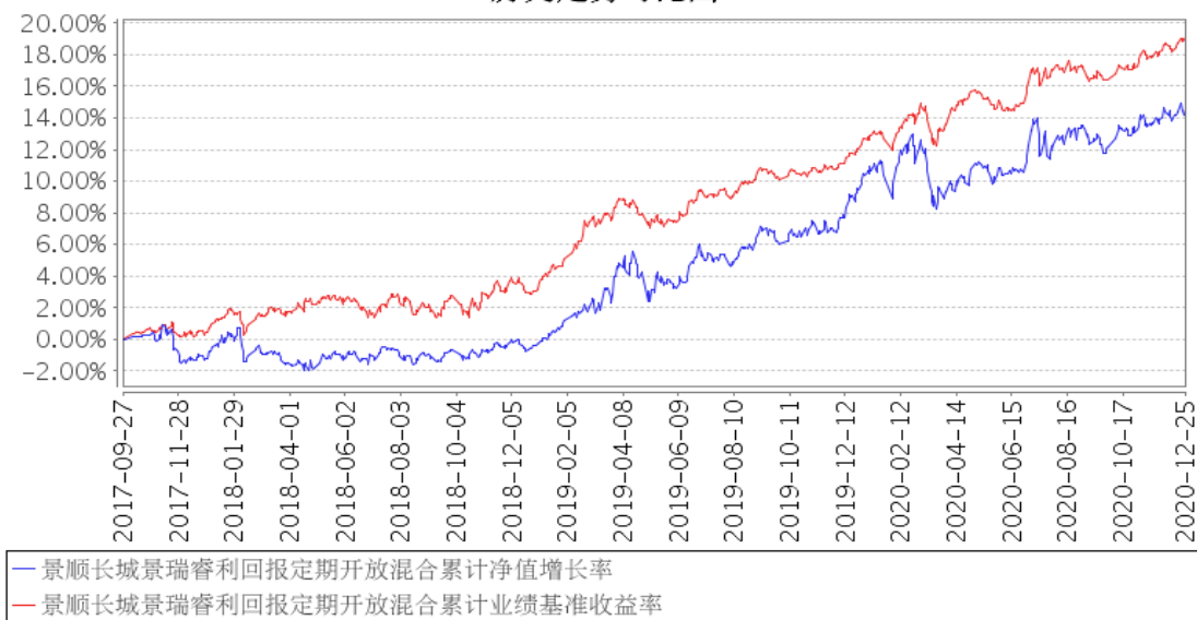
景顺长城景瑞睿利回报定期开放混合累计净值增长率与同期业绩比较基准收益率的历史走势对比图

注：本基金的投资组合比例为：本基金投资于债券资产的比例不低于基金资产的 70%（开放期开始前 10 个工作日至开放期结束后 10 个工作日内不受此比例限制），股票、权证等权益类资产的投资比例不超过基金资产的 30%，其中，本基金持有的全部权证的市值不得超过基金资产净值的 3%。任一开放期内，本基金持有现金或到期日在一年以内的政府债券不低于基金资产净值的 5%，封闭期内不受前述 5% 的限制。本基金的建仓期为自 2017 年 9 月 27 日基金合同生效日起 6 个月。建仓期结束时，本基金投资组合达到上述投资组合比例的要求。