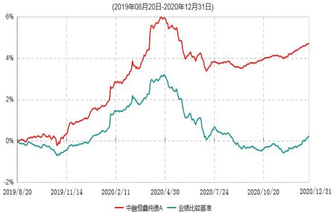
中融恒鑫纯债A累计净值增长率与业绩比较基准收益率历史走势对比图