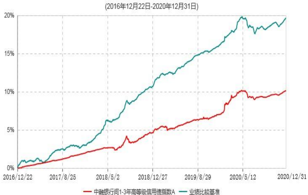
中融银行间1-3年高等级信用债指数A累计净值增长率与业绩比较基准收益率历史走势对比图